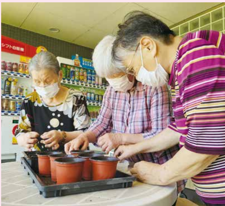
▲こんな昔やったわねと植えを楽しみ施設利用者

今回の「RUN伴+（プラス）」はそんなRUN伴のスピノフとして、「走る」という表現のみならず、それぞれの地域で考え「認知症になっても住みやすいまち」にしていくための企画です。山武市、横芝光町、芝山町の実