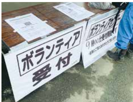
千葉県社会福祉協議会(千葉県)

受付班 ボランティアの受け入れ、保険加入手続き及び未加入者の手続き、活動報告受付(継続ニーズの把握) ニーズ班 被災者からのニーズ把握 マッチング班 被災者ニーズとボランティアの活動希望のマッチング