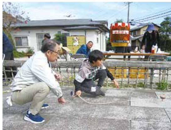
▲教わったコマが上手に回ると歓声が

10月29日、芝山町辺田地区にある龍泉院の境内に、子どもたちの声があふれています。この日開かれた「菱田っ子まつり」は地区の子どもと保護者を中心として地域全体で交流することを目的に、菱田地区社協が主体となり催された誰もが楽しめる新たな地域イベントです。まつりには地域の人たちが手作りの輪投げや景品釣りなども用意され、子どもたちは夢中でアトラクションに挑戦。まつりの最後を飾ったのは、手作りのハロウィンカラーのお神輿。子どもたちみんながわっしょい、わっしょい。地域一丸となってまつりをおおいに盛り上げました。