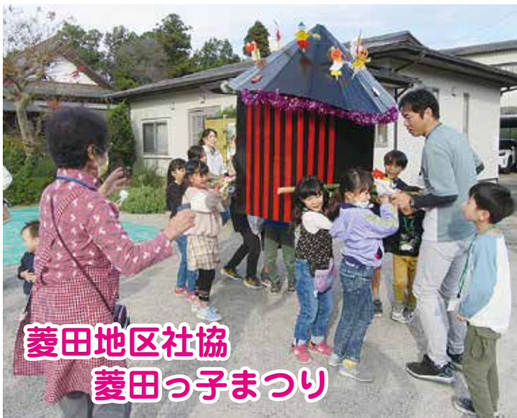
菱田地区社協 菱田っ子まつり